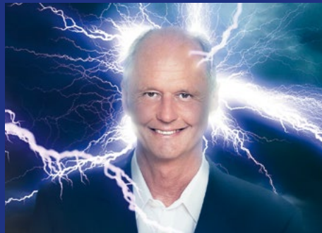
Kröhnert XXL – Großes Parodistenkino REINER KRÖHNERT 27. und 28. September, 19.30 Uhr